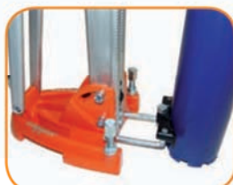
Регулируемая направляющая коронки. (CDR162).