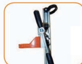
Крепление рукоятки с левой и правой стороны.