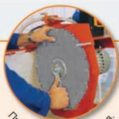
Простота замены дисков.