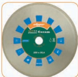
CLASSIC CERAM Ø 250 x 25,4 мм