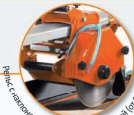
Рельс с наклоняющейся режущей головкой (от 0° до 45°).