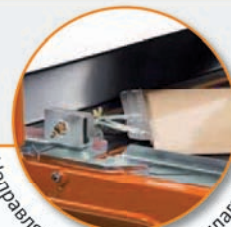
Направляющая для резки прилагается.